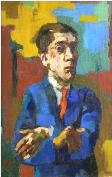
Oskar Kokoschka (1886–1980)

Selbstbildnis mit gekreuzten Armen , 1923