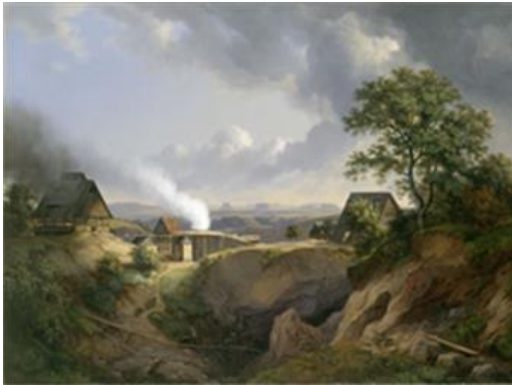
Abb.: Ernst Ferdinand Oehme, Landschaft bei Maxen mit Blick auf das Elbsandsteingebirge, 1838 Kunstsammlungen Chemnitz, Foto: bpk/Kunstsammlungen Chemnitz/PUNCTUM/ Bertram Kober