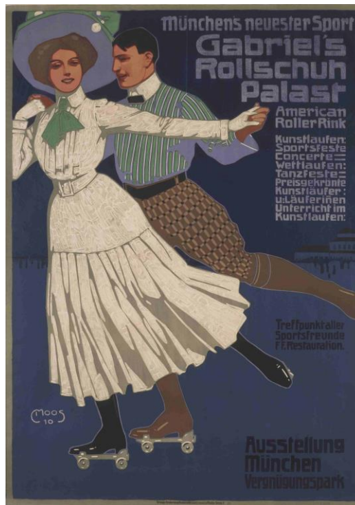
Abb.: Carl Moos, Münchens neuester Sport Gabriel's Rollschuh Palast, 1910, Kunstsammlungen Chemnitz, Foto: Kunstsammlungen Chemnitz/ László Tóth