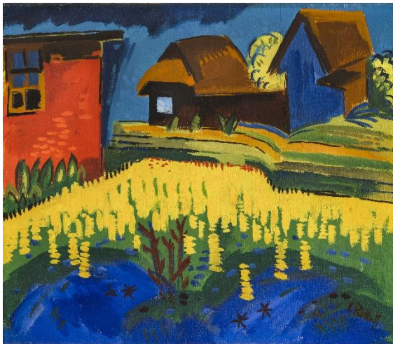
Abb.: Karl Schmidt-Rottluff, Lupinenfeld , 1921 88 x 101,5 cm, Öl auf Leinwand