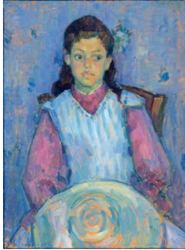
Alexej von Jawlensky: Mädchen im Rosa Kleid, 1906, Öl auf Malkarton

Bei einem Rundgang erkunden wir die unterschiedlichen Darstellungsweisen von Kindern in den Werken von Otto Dix und Paula Modersohn-Becker und setzen uns mit der Frage auseinander, was das Leben von Kindern damals prägte und was es heute prägt. Was erzählen uns die Kinderbildnisse von der Kindheit und die Sichtweise auf Kinder?